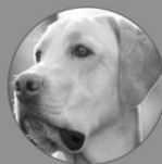
Polo Director de inspecciones

Emprendedor Serial Ingeniero Electrónico MBA